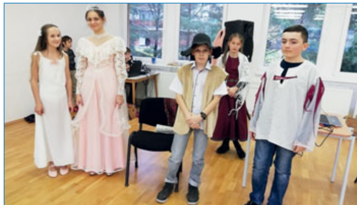
Účastníci projektu ztvárnili pověsti o vzniku svých měst.

V rámci projektu Erasmus navštívili zástupci Základní školy Tyršova slovenské partnerské město Kremnica. Výjezdu se zúčastnilo osm žáků a tři vyučující. Během pobytu navštívili Muzeum mincí a medailí, v galerii vytvářeli lepoprela o městě Kremnica, a také sfárali do dolu, ve kterém se těžilo zlato a stříbro, a dozvěděli se, že spousta zlata a stříbra zůstala ještě nevytěžena.