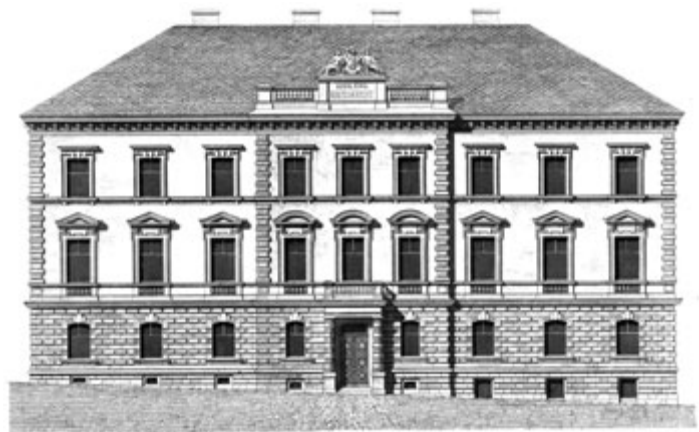
Před 140 lety byla slavnostně otevřena budova krajského soudu, plán Otto Thienemanna z roku 1880.