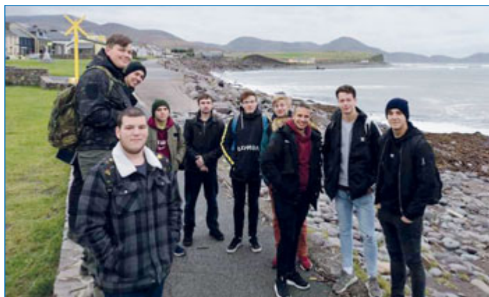
Studenti střední zemědělské a technické školy na zahraniční stáži v Irsku