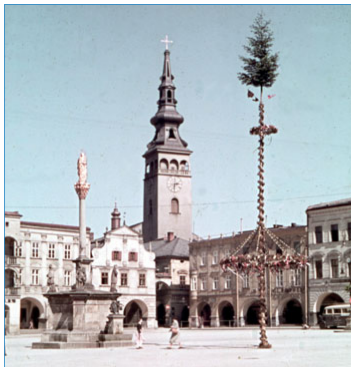
Před 310 lety byl slavnostně vysvěcen Mariánský sloup na náměstí, fotografie z roku 1938.