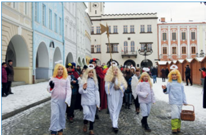
Městem prošel 6. ledna Tříkrálový průvod.