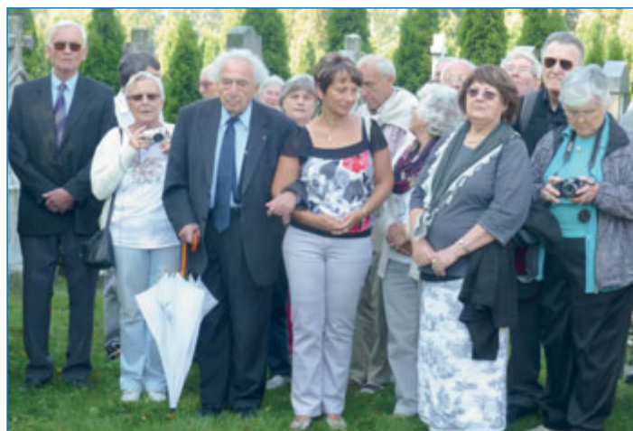
S přáteli při prohlídce lapidária zdejšího hřbitova.