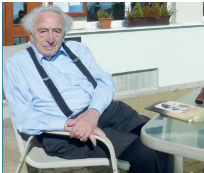
Max Mannheimer při své poslední návštěvě Nového Jičína v roce 2013.

mimo jiné ve svých osmdesáti letech 31. října 2000 promován doktorem honoris causa na Filozofické fakultě historických a uměleckých věd Ludwig-Maxmilians univerzity v Mnichově. Jeho usilovný celoživotní boj proti nacismu byl odměněn řadou vyznamenání, řádů a odznaků.